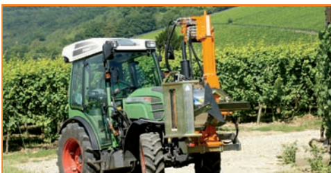
Entlauber EB 490 einseitig