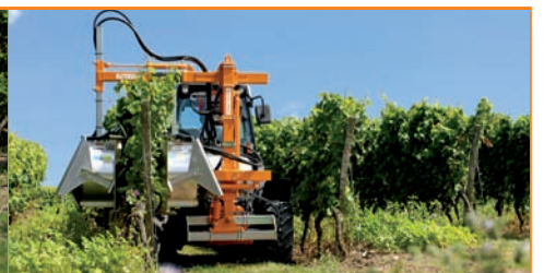
Entlauber EB 490 Überzeilen