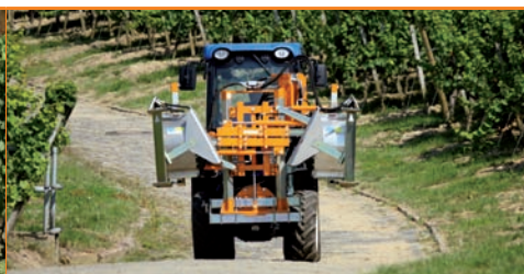
Entlauber EB 490 zweiseitig